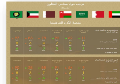
منصة الأداء التنافسية