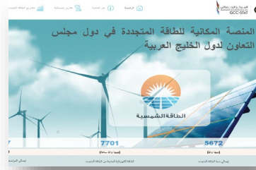
منصة الطاقة المتجددة