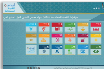
منصة التنمية المستدامة