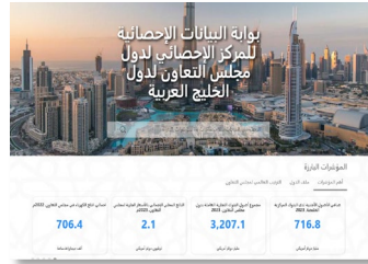
بوابة البيانات الإحصائية