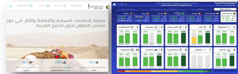
منصة السياحة والثقافة والآثار