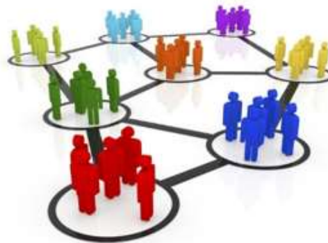
Research topics sub-task teams