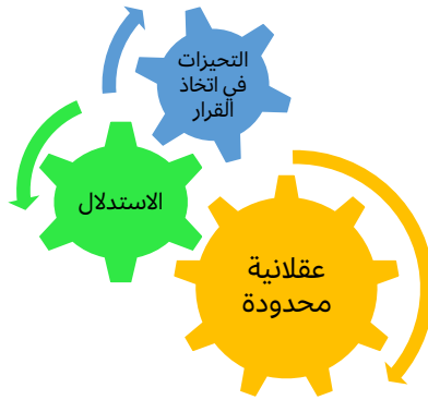
شكل 1. أسس علم الاقتصاد السلوكي

الآن وما يمكن أن يحدث في المستقبل. لذلك فهي تعتمد على بيانات حقيقية يتم تحليلها للوصول إلى قوانين أو نظريات. والنموذج الوصفي الجيد هو الذي يستطيع الكشف عن تكوين البيئة المراد دراستها ويحولها إلى لغة رياضية يسهل دراستها، ويمكن الحكم على قيمتها العلمية والعملية بمقدار قدرتها على تفسير وكشف البيئة المدروسة. في هذا السياق، يوضح الشكل (1) أسس علم الاقتصاد السلوكي، حيث يظهر تناقض بعض المبادئ التي كانت محل اتفاق بين علماء الاقتصاد، إذ العقلانية محدودة وليست مطلقة، والتحيزات هي جزء من طبيعة البشر، ويتم استخدام الاستدلال (أو الحدس) للمساعدة في اتخاذ القرارات، وكل واحد من هذه العناصر -كما سيأتي شرحه- سبب ومسبب لغيره من العناصر.